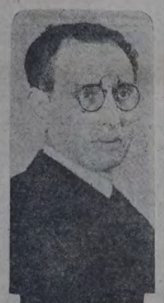
AUTOR DE LA OPERA "EL MATRERO", estrenada recientemente en el Colón.