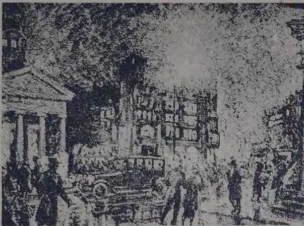
VISTA NOCTURNA DE LA PLAZA DE POTSDAM, BERLIN