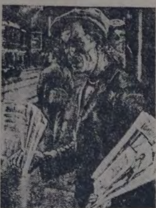
EL VENDEDOR DE DIARIOS