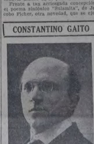
AUTOR DEL "POEMA COREOGRAFICO" titulado "La flor del Irupé", cuyo estreno acaba de ofrecerse en el teatro Colón.

cuyó a continuación, fué un rudo contraste. "Sulamita" es un trabajo meritorio, pero demasiado placido, sencillo, poco consistente y de escaso contenido, a pesar de la copiosa literatura que se ha inspirado. Las versiones de Nikolai Malko, especialmente la de la "Sinfonía", fué brillante y animadísima. La nota ingrata del concierto fueron las interpretaciones del "Preludio" de Lohengrin, la "Cabalgata" de Walkirias, de Wagner, versiones, sobre todo esta última, dignas de un primer ensayo, pero inaceptables en una audición pública. Señalamos ya, hace pocas días, que la orquesta no estaba preparada para seguir a un director de la modalidad de Malko. El desconcierto de la orquesta y la falta de unidad entre director y ejecutantes que las interpretaciones que comentamos evidenciaron hoy, nos ha dado la razón.